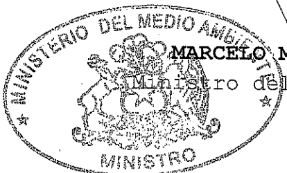
MARCELO MENA CARRASCO Ministro del Medio Ambiente